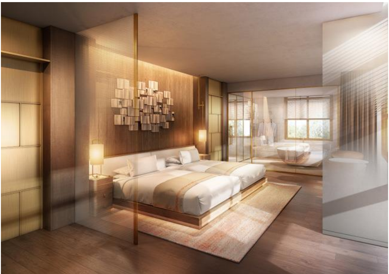
新ホテル 客室イメージ (1)