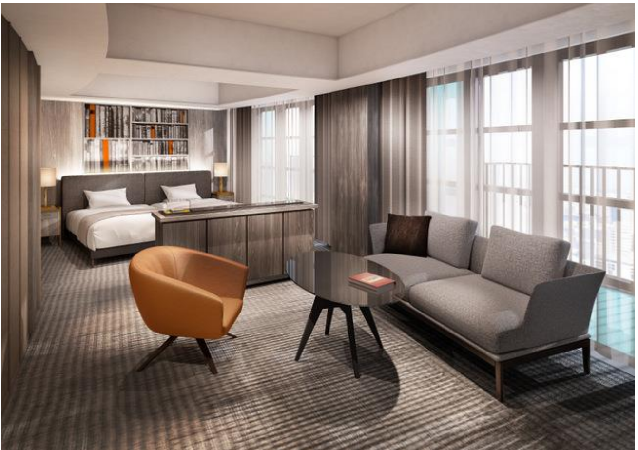
新ホテル 客室イメージ (2)

「ハイアット リージェンシー 福岡を設計したマイケル・グレイヴス氏に、私も学生時代から影響を受け、書籍（作品集）を購入し、よく修学しました。今回、同氏の日本での代表作ともいえる、当ホテルのリニューアルに携わらせて頂けること＝偉大な建築家の作品へ手を入れることに身が引き締まる思いです。同氏のデザインした独創的なポストモダン建築が持つ、圧倒的なスケール感、素材感、色彩を最大限尊重しつつ、そこに新しく、上質で、遊び心のあるデザインを付加することで、それぞれの要素が相乗効果を生み出し、新しい調和を奏でる事を目指しました。」