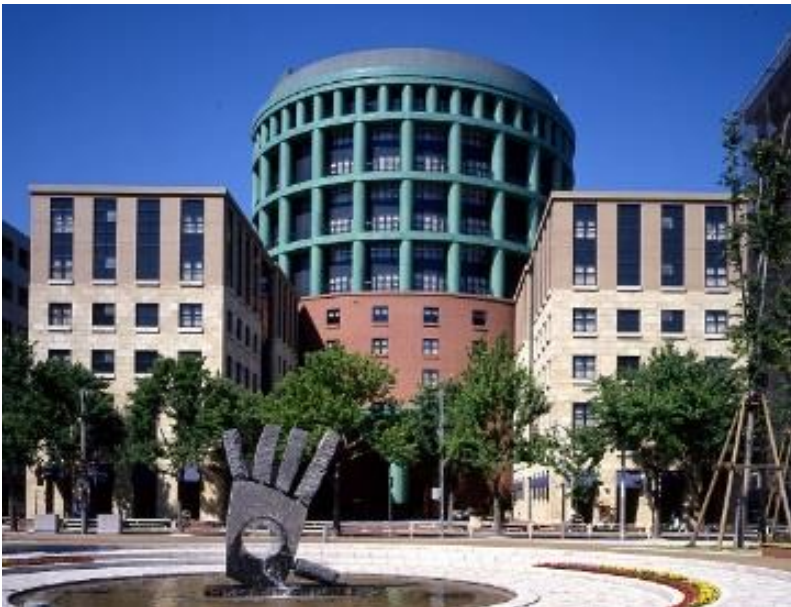
ハイアット リージェンシー 福岡 外観

開業日 1993年 7月 2日 所在地 福岡市博多区博多駅東 2-14-1 客室数 246室 URL https://www.hyattregencyfukuoka.co.jp